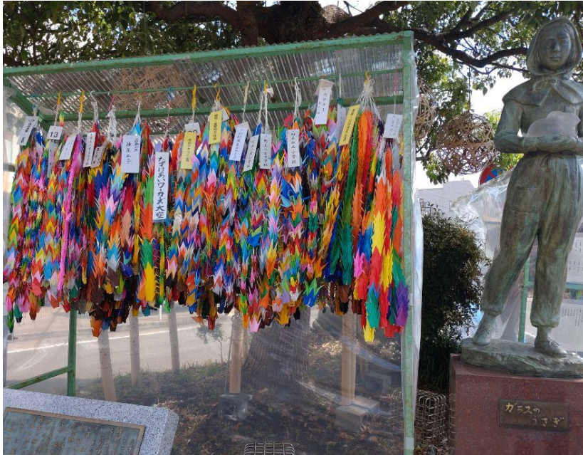
千羽鶴で飾られたガラスのうさぎ像