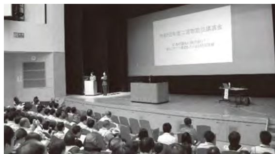
☎ 防災安全課危機管理班(☎71-3319)