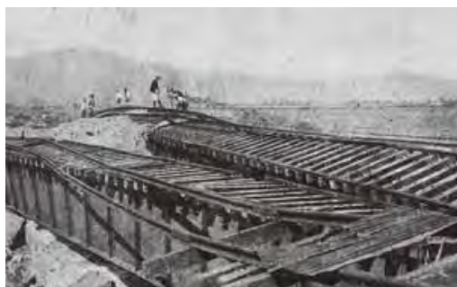
関東大震災当時の被害の様子、二宮駅⇄国府津駅間