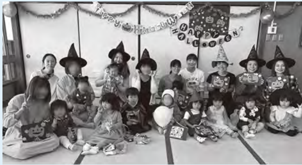
☎ 子育て・健康課子育て支援班(☎71-5862)