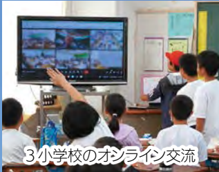
3小学校のオンライン交流