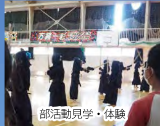
部活動見学・体験