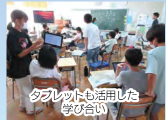
タブレットも活用した 学び合い

子どもたち同士による学び合いや話し合いの授業などを通じて、思考力・判断力・表現力などの資質・能力を育てています。また、1人1台のタブレット端末を活用して、自分の考えを表現したり、互いの考えを共有したりしています。