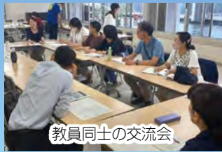
教員同士の交流会

小・中学校の教員の共同によるカリキュラム研究を通じて、小学1年～中学3年までの学びのつながりを可視化するとともに、子どもたちが進んで学習に取り組みたくなる魅力ある授業づくりを進めています。また、それぞれの教員が教えている学校以外の子どもたちと過ごす体験交流も継続して実施しています。