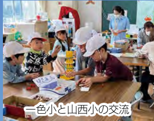
一色小と山西小の交流

学校の垣根を越えた小学生同士の交流をオンラインや対面で行いました。中学校進学に向けた関係づくりのほか、手紙による交流や相互の学習発表などの交流にもつながっています。