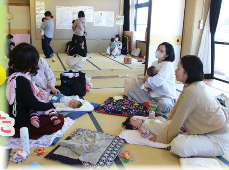
フリースペース「でんでんむし」の様子