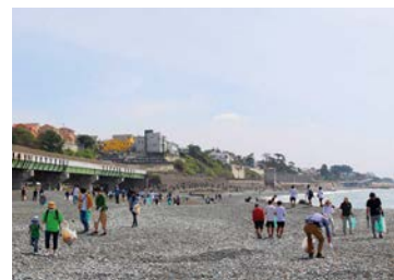
湘南にのみや530キャンペーンの様子