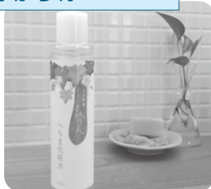
⑦ さっぱり&しっとり！ へちま化粧水