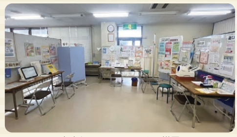
未病センターにのみやの様子