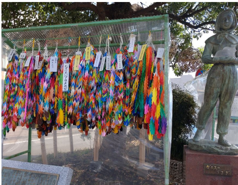
千羽鶴で飾られたガラスのうさぎ像