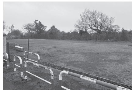
国立小児病院跡地。売却検討で、また 一つ町民の財産が消えていくのか。

A 町の重点方針、防災、社会福祉、高齢者福祉、障害者福祉、公共交通、などの重点方針の計画、施策は、誰ひとり取り残さないということを踏まえて策定し、推進する。