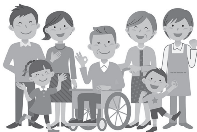
「こどもまんなか」は 誰も取り残さない町づくり

A 目標達成は容易ではない。区域施策編の方針を推進、達成を目指す。審議委員に生物多様性の専門家である大学教授を招き、計画は職員だけで取り組む。予算は検証しながら進める。 ※他に地域経済、行政改革等を取り上げた。