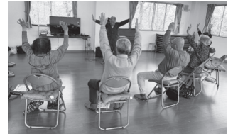
体操の後は各自が自由に 遊べる工夫が大切。

A タクシー券の交付条件は、2つの交付の制度がある。1つは要介護3以上の方で、通院などを中心に使用する。もう一つは、歩行するときに常に杖などが必要な方で条件に合えば、別に行き先等を縛らないので、通いの場へも使用可能である。