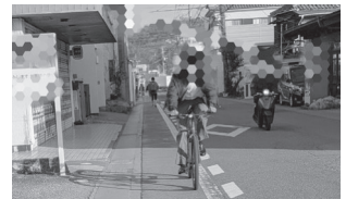
今までの何げない乗り方が青切符対象になりますよ！

A 今回の法改正に合わせて特段のことは考えていないが、警察へ規制標示の補修依頼を継続し反射材の設置等で視認性を高める。ナビラインは道幅の制約があるが、効果的な安全対策を研究・工夫し、誰もが安全に走行できる環境確保に努める。