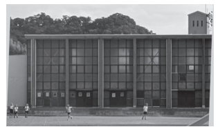
二宮小体育館老朽化著しく窓があかず夏はサウナ状態