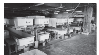
ウニ畜養殖設備(多段水槽)をプール槽内に設置(例)

【要望】何もせず指定管理者任せは良くない。将来の財産となるよう事業者・町民・町が一体となって育てていけるよう事務的支援を求める。