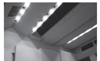
崩落の危険性を知らせる必要 はないということですね