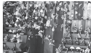
1～2月、知足寺や川勾神社で色鮮やかに飾られている

A 地域の活動や団体の取り組みと連携できる可能性があるかという視点から他自治体の事例等も参考にし状況を確認する。