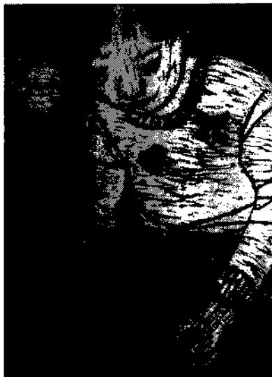
平成30年度児童作品