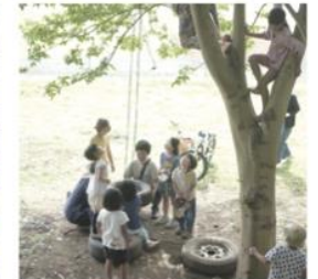
にのみや子ども自然塾