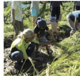
農ある暮らしを広める会