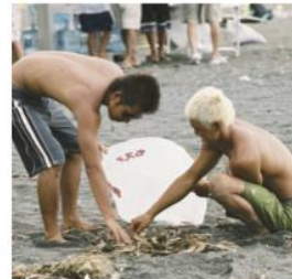
うみびか(大磯ビーチクリーン)