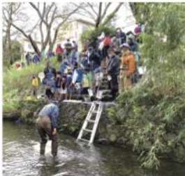
葛川をきれいにする会