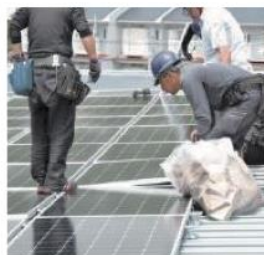
グリーンエネルギー湘南