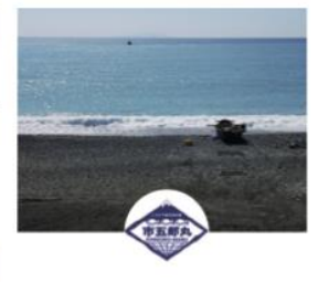
観光地引網 市五郎丸