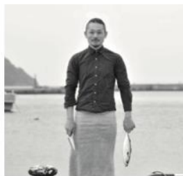
Kai's Kitchen ninomiya