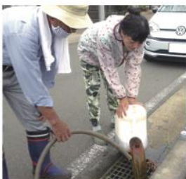
地域の環境を良くする会