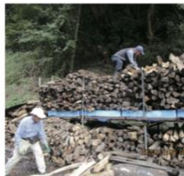
湘南二宮・ふるさと炭焼き会